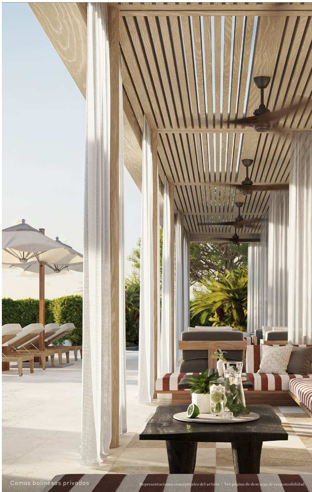
Camas balinesas privadas

Representaciones conceptuales del artista Ver página de descargo de responsabilidad.