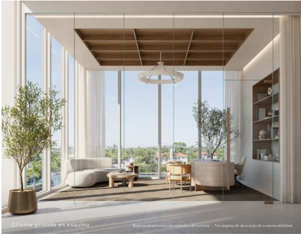
Oficina privada en esquina

Representaciones conceptuales del artista | Ver página de descargo de responsabilidad.