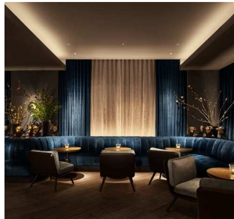
Anda Andrei Design 11 Howard Hotel, NYC