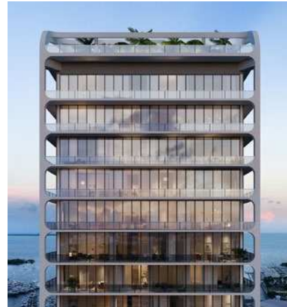
Meyer Davis Mr. C Residences, Coconut Grove, FL