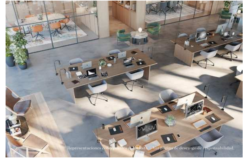
Representaciones conceptuales del artista | Ver página de descargo de responsabilidad.