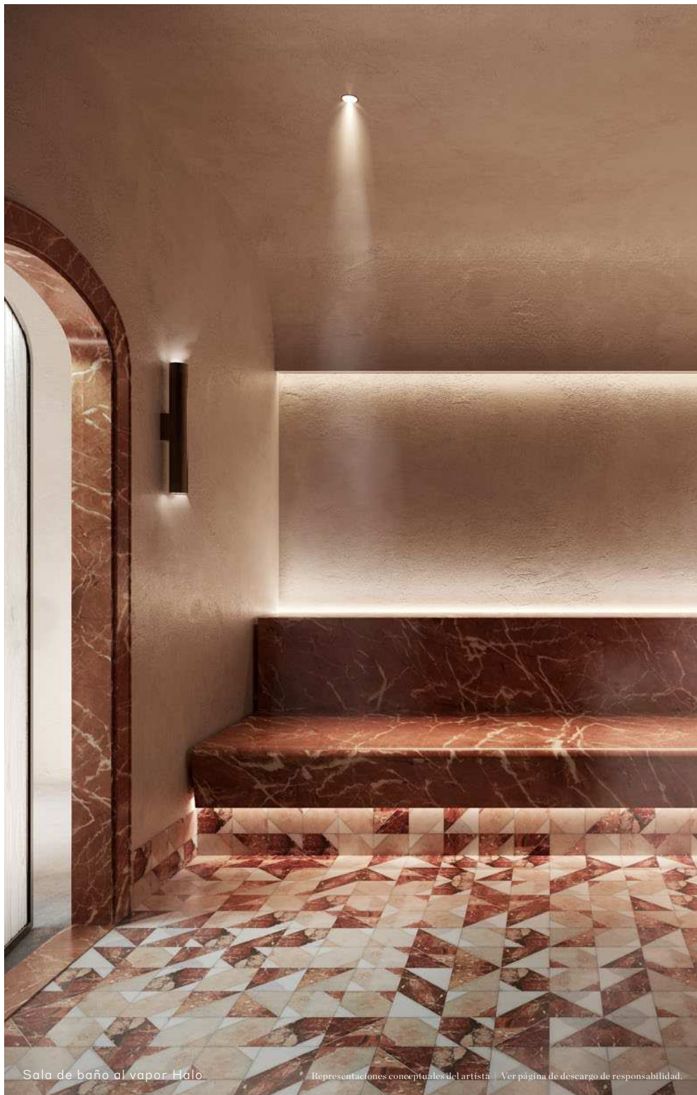
Sala de baño al vapor Halo

Representaciones conceptuales del artista | Ver página de descargo de responsabilidad.