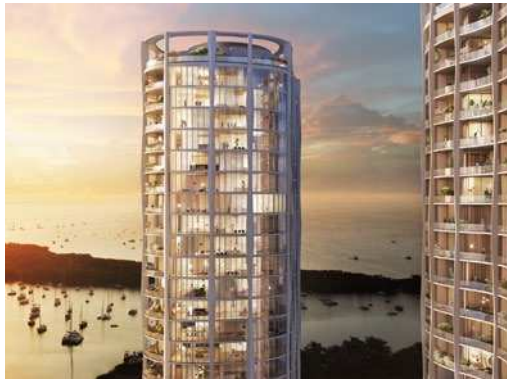
Terra Park Grove, Coconut Grove, FL