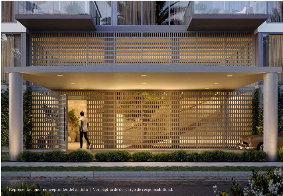
Representaciones conceptuales del artista | Ver página de desargo de responsabilidad.