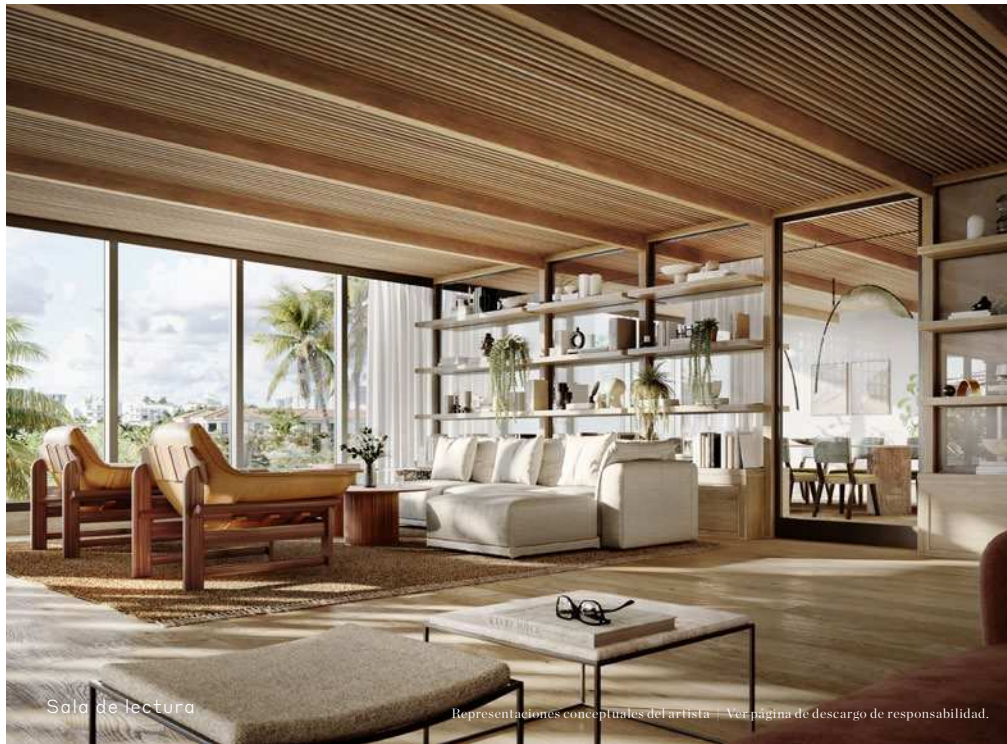
Sala de lectura

Representaciones conceptuales del artista | Ver página de descargo de responsabilidad.