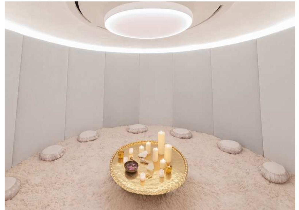
THE WELL New York