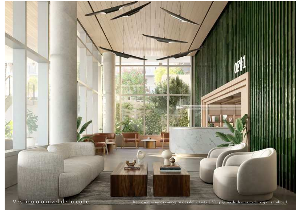
Vestíbulo a nivel de la calle

Las oficinas de THE WELL Bay Harbor Islands representan un entorno de trabajo único para aquellos que buscan estilos de vida profesional excepcionales donde su bienestar es tan importante como su productividad. Un total de 98 420 pies cuadrados (9143.51 metros cuadrados) de oficinas, vestíbulos y espacios en la terraza diseñados pensando en su bienestar, ambos pueden alcanzarse.