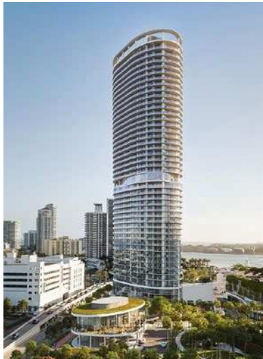
Arquitectonica Five Park, Miami Beach, FL